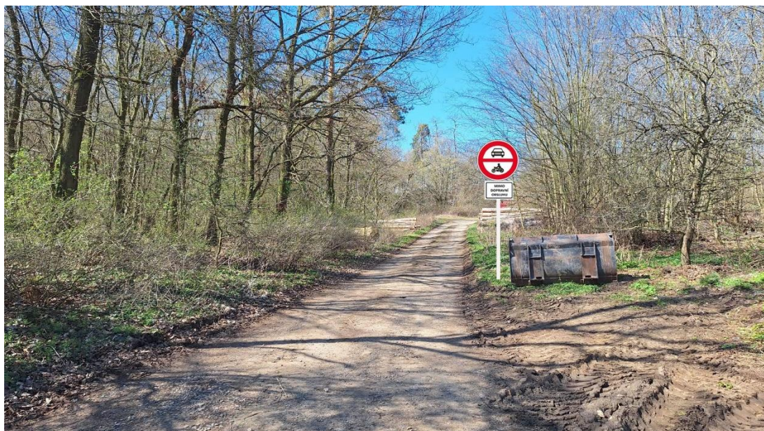
7 ulice Karlická (u hřiště)